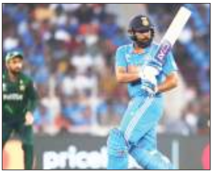
अहमदाबाद के नरेंद्र मोदी स्टेडियम में भारत के कप्तान रोहित शर्मा ने शानदार 86 रनों की पारी खेली।