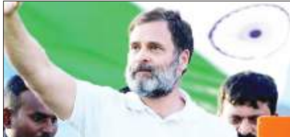
राहुल गांधी ने बीआरएस सरकार पर साधा निशाना: राहुल गांधी ने सोशल मीडिया पर लिखे

टीम एक्शन इंडिया/हैदराबाद कांग्रेस ने शनिवार को तेलंगाना की बीआरएस सरकार पर जमकर हमला बोला। राज्य में 23 साल की एक महिला द्वारा आत्महत्या करने को लेकर राहुल गांधी ने आरोप लगाया कि यह आत्महत्या नहीं बल्कि युवाओं के सपनों की हत्या है। राहुल गांधी ने कहा कि बीते 10 सालों में बीजेपी रिश्तेदार समिति बीआरएस और भाजपा ने मिलकर अपनी अयोग्यता के चलते राज्य को बर्बाद कर दिया