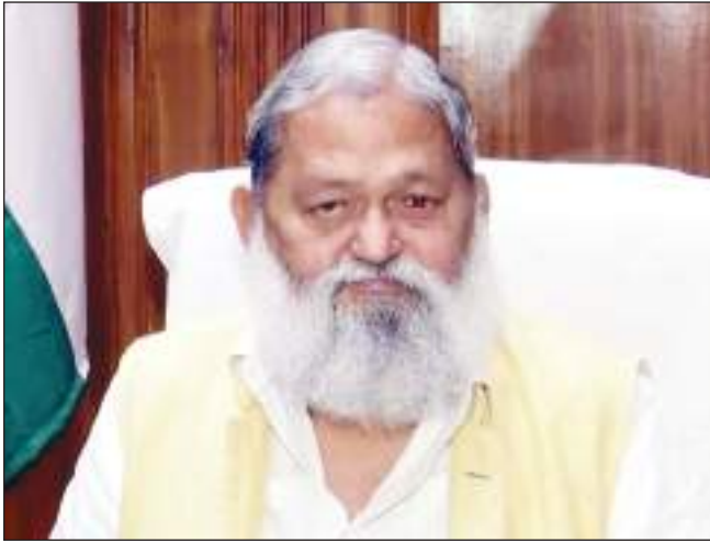
मेडिकल कॉलेज बहुत बड़ा तोहफा है। अब मेडिकल में दाखिला लेने वाले विद्यार्थियों को दूसरे राज्यों में जाने की बजाय